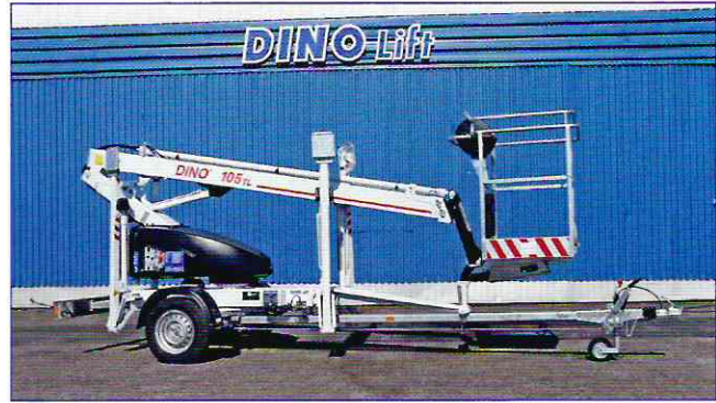
Mühelos mit PKW ziehbar