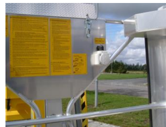
230 V Anschluss im Korb